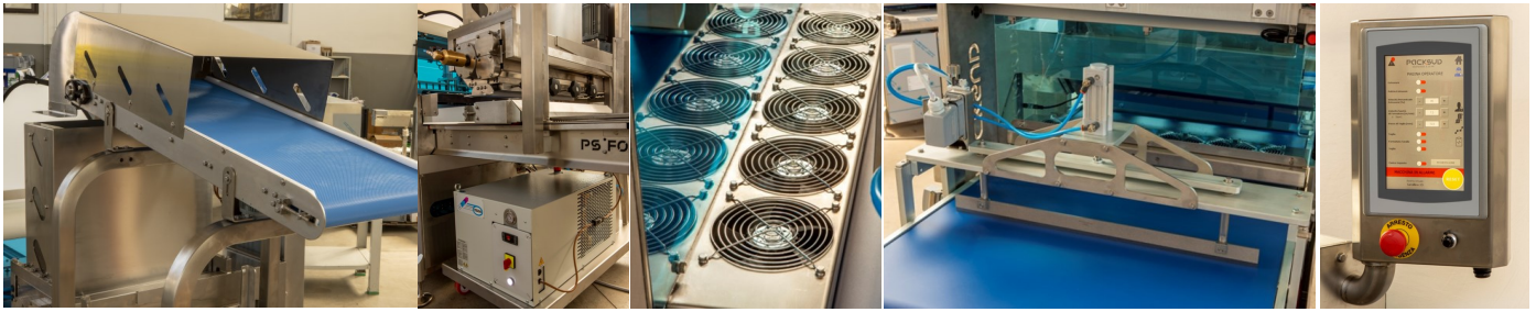
Nastro caricamento impasto